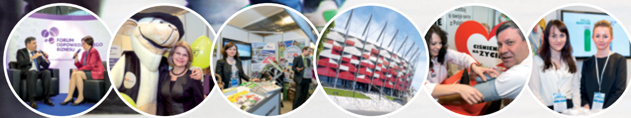
fot. 5. Targi CSR / 2014r.